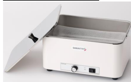
ヒートパン(TAH-1202) サイズ 外寸 427(W) × 295(D) × 233(H)mm 内寸 372(W) × 262(D) × 114(H)mm