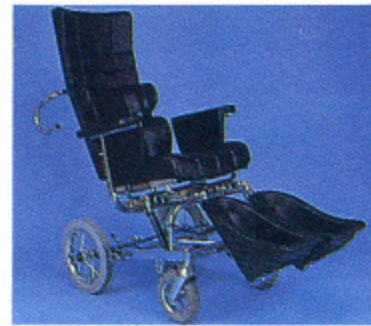
第6図 オットーボックホイールベースの使用によりシートとバックレストの角度を変えることなく27°傾けることができる。

信頼できるブレーキシステム、及び一般的安定性はどうしても必要な要素である。フットレストやレッグレストに粗雑な、或いは鋭利な縁があってはならない。患者の肌に触れるところはすべてパッドで覆う必要がある。もし、高齢者を椅子に適切に座らせたなら、前方に滑りだしたり、椅子から落ちたりすることはないはずである。しかし、時には膝バンドが必要なこともある。