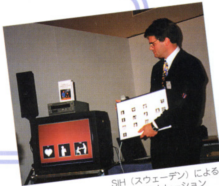
SIH (スウェーデン) による デモンストレーション