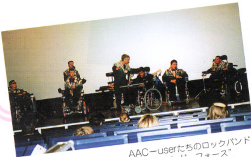
AAC-userたちのロックバンド “ウインド フォース”