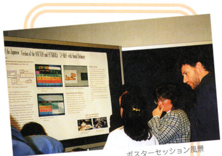
ポスターセッション風景 S&Sの発表も行われた

演題発表では、AAC-user自身の発表もあり、北欧、ヨーロッパの障害者の旺盛な自立心とそれを支援する社会のふところの深さを見る思いがした。私たち研究会のメンバーはサウンズ アンド シンボルズの臨床結果と先に開発したコンピュータプログラム(商品名・とくでっせ、Ver.1)に関する結果をポスターセッションにて発表し、“KANA”(仮名文字)の入った日本のAACということで多くの参加者の関心を集めた。また、スウェーデンのS I HはP I C (Pictogram Ideogram Communication)を自国むけに改良し、コンピュータ・プログラム化し、AACとして有効に活用されている様子がビデオセッションにて紹介された。ブリス・インスティテュートからは、シンボルを用いた性教育の実際がポスターセッションで発表され、いずれも大いに触発されるところがあった。AACが障害者の社会生活のみならず、人格形成やsexualityの確立に活用されており、わが国でもAACの概念を今一度、深め、検討し、その上での研究、技術開発が必要ではないかと考えさせられた。