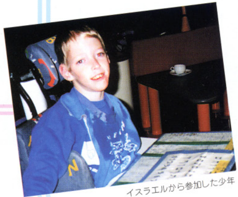
イスラエルから参加した少年