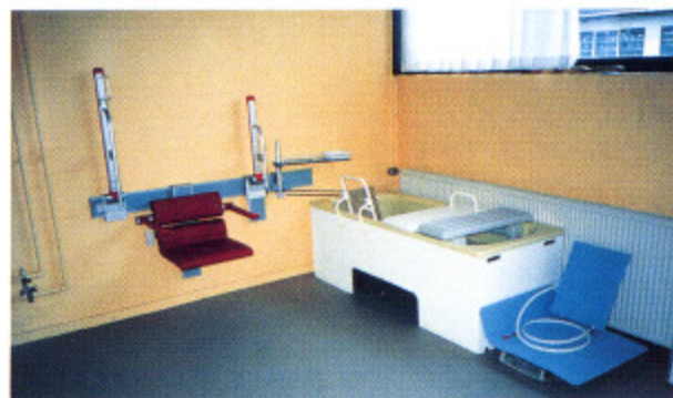
写真2 テクニカルエイドセンターの浴室評価室（オールボー市）