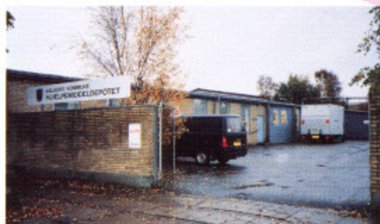
写真5 オールボー市の補助器具倉庫外観