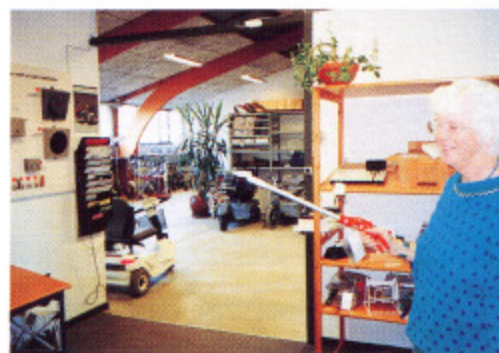
写真3 適用技術に関する試用・調整・助言室