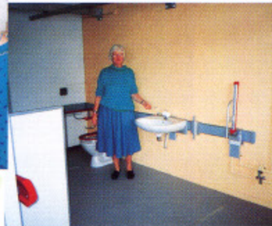
写真4 トイレのシュミレーションルーム 便器以外の洗面台、手すり、壁面の移動が可能

市（Local）レベルでは、福祉機器の供給の決定・供給のほか、他の社会的サービスを一元化して行っており、すべてのサービスは、住民にもっとも近い市レベルで行われます。市には、専門の作業療法士がおり、本人や本人の周囲の看護婦やヘルパー、近隣の人々から電話1本で機器やサービスの依頼をする事が出来、依頼によって市の作業療法士が訪問し、評価した上で適用技術やサービスを決定します。（図1）。福祉機器は、市の設置した補助器具倉庫（写真5）にメーカーから買い取られて常時在庫しており、指示があれば即座に供給されます。また、補助器具倉庫に在庫していないものはメーカーから取り寄せられ供給されます。