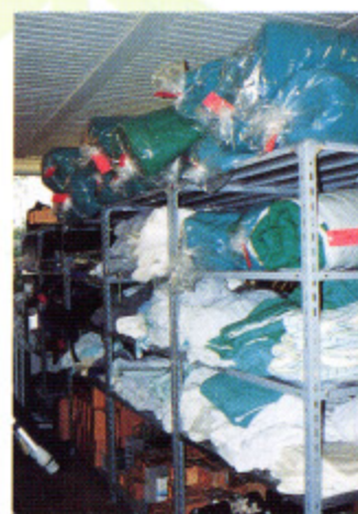
写真9 補助器具倉庫内のリサイクルされたスライディングシートやマット類