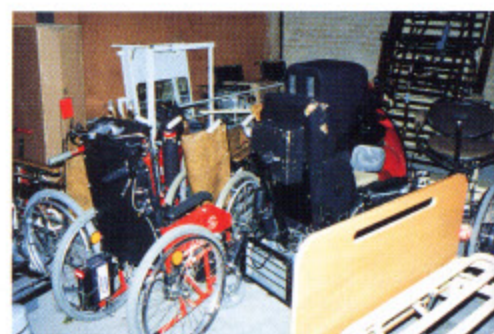
写真12 雑然と保管されるリサイクルされた特殊機器