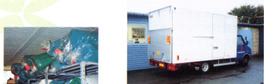
写真10 補助器具搬送用トラック