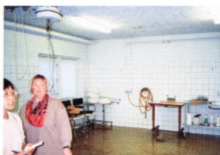
写真6 補助器具倉庫の洗浄ルーム 左から2番目が所長の作業療法士

ーなど消毒」などを経たりサイクルは全く行われておらず、このような機器も全くありませんでした。これらの消毒を必要とする用具は、リサイクルの方が経費がかかるためと考えているようです。また、運送車両（写真10）の衛生管理も行われていませんでした。一方、保管については、かなり多種多量の機器があり（写真11）、かなり手狭な状態になっていました。このようなリサイクルシステムは、その後訪問したスウェーデンでも同様でした。当初、充実したリサイクルシステムが導入されていると考えていましたが、ほとんど期待したほどではありませんでした。（つづく）