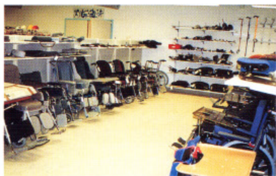
写真1 デンマークのテクニカルエイドセンター

県（Country）レベルでは、地域の専門家の活動範囲以外の特別なサービスを行っています。デンマークには14の県とコペンハーゲン市が県レベルに取り扱われており、必ず1つの補助器具センター（テクニカルエイドセンター）（写真1）とリハビリテーションセンター、県立病院、社会福祉施設を設置しています。県の補助器具センターの主な働きは、市の調整者（作業療法士）やユーザーが適切な補助器具を見つけるための多種の機器の展示、試用のチャンス（写真2）と、指導・助言を行うことです。特に、補助器具の機能と適用技術に関して試用や調整（写真3, 4）、機種選択の支援、家庭と職場の調整など幅広い助言サービスを行っています。また、各種サービスの普及・教育も行っています。