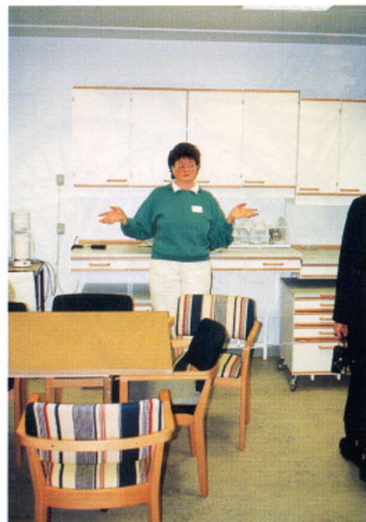
図-17 テクニカルエイドセンター内の評価用台所すべての家具が上下動する