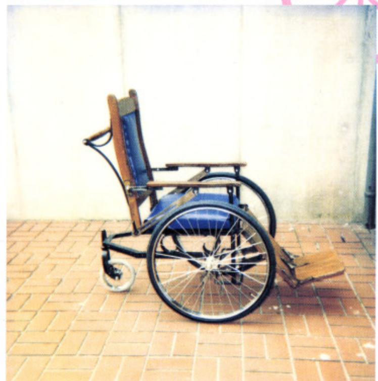
図2 平成7年10月 寄贈 昭和35年頃交付