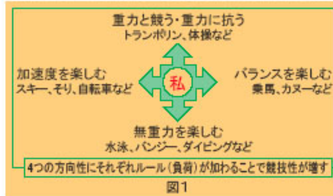
図1に私のテーマである「重力と遊ぶ」の模式図を示します。障害のある子どもたちはなんらかの理由で重力加速度を適切に捉えることができなくなります。そのことが筋緊張の異常や行動の異常となって現れます。そのため一見スポーツを楽しむことが難しく見えます。しかし実際には環境や道具