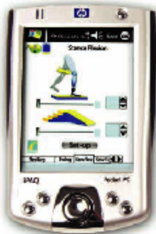
図7 立脚期と遊脚期での伸展の設定は路面(不整地か階段・坂)によって調節できる

スタンス・フレクション、スタンス・エクステンション、スイング・エクステンションの設定は、スロープ、階段、不整地のそれぞれで選択することができる。(図7)これらの機能を使用したことの無い装着者には、適切な専門家の指導や警告のもと、訓練が行われるべきである。