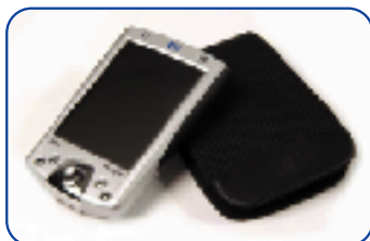
図6 膝継手の制御メカニズムの調節とコントロールに使用する、標準的なポケットコンピュータ(PDA)

標準的なポケットコンピュータ(PDA)を、調節とコントロールに使用する。PDAにはリオロジック・ソフトウェアがインストールされており、電池の残量、ステップ数、適合モードを表示する。適合パラメータ、警告シグナル、ユーザーリストは変更できる。義肢装具士は装着になれたユーザーにPDAを提供することもできる。