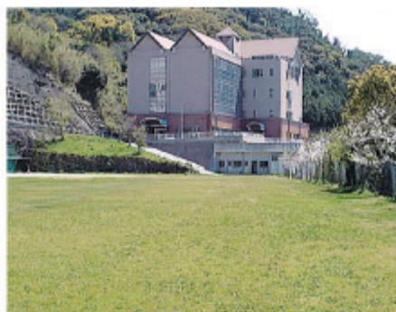
グラウンド 20993m 2

本校は長崎市東部の風頭の台地に建てられ、愛宕山を背景として美しい長崎港を眼下に臨む絶景の地にあります。周囲を緑の木々に囲まれ、目前には広大なグラウンドという良好な教育環境を誇っていますが、長崎市街中心部までバスで約15分という利便性も兼ね備えています。また、教育内容では実学を建学の精神として掲げ、専任講師陣をはじめ、長崎大学医学部、各医療機関・施設などのご協力により、優秀な講師陣で教育にあたっています。現在までに約300名近くの卒業生が長崎県下のみならず、全国へ巣立っていきました。