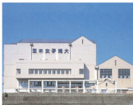
ますみ記念館 アリーナ (体育館)、大ホール (858名収容)