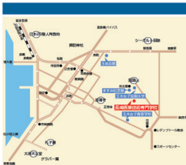
●バス（長崎バス）長崎駅前より25分（風頭山行・終点下車・徒歩5分）