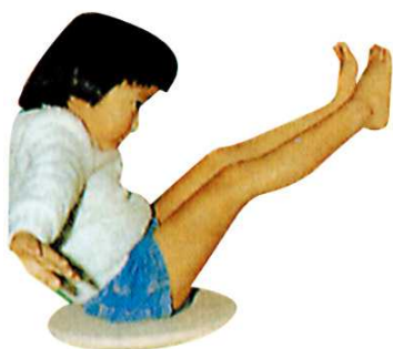
座位でのバランス感覚