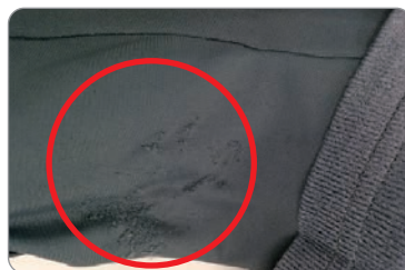
ストラップマジックによる毛羽たち ※ストラップマジックがスリーブに当たると毛羽たちを起こします。