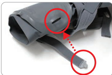
ストラップが外れた