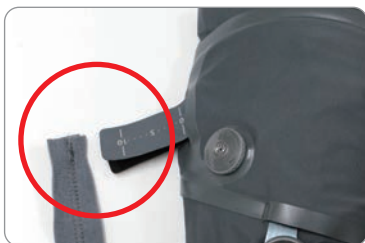
マジックテープが外れた

次のような場合は、身体に装具が適合していない恐れがあります。弊社へご連絡ください。