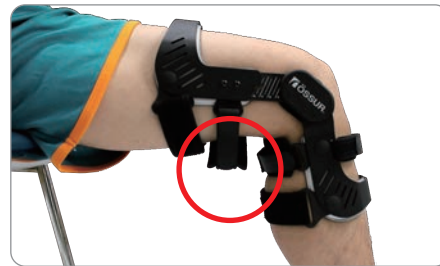
バックル締めてもストラップが緩い